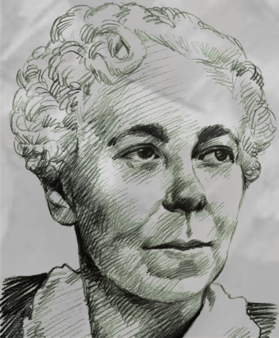
Karen Horney (1885-1952)

Sociedad Española de Historia de la Psicología