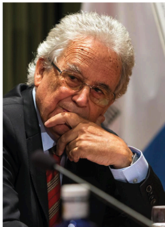
Santos Juliá Profesor y catedrático

Las clases se inician el 9 de octubre de 2017 y terminan el 30 de mayo de 2018.